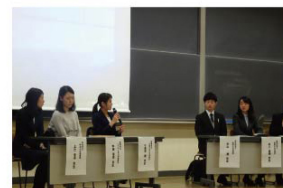
パネルディスカッション

本学では、COC+事業の一環として「COC+キャリアフェア」と題したプログラムに本年度より取組んでいます。本プログラムでは、京都府南部地域を中心とした企業や事業者等と学生の出会いの場を設け、就職時の地元定着に向けた良好な関係性を構築するだけでなく、地元企業や事業所についての理解を深め、就業観を養うことを目的としています。今年度は、2017年9月16日(土)に「【PSW課程】医療・福祉分野のキャリアデザイン」、2017年12月2日(土)に「キャリアデザイン～小学校教員と話そう～」の2回実施しました。