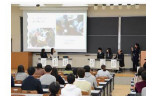
先輩教諭による「授業」プレゼンテーション

「小学校教員養成コース キャリアデザイン～小学校教員と話そう～」では、宇治市や京都市伏見区、木津市等の京都府における小学校現場で教員として勤務している先輩学生(教育福祉心理学科小学校教員養成コース第1期生)5名を招き、教員になるまでに取組んだことや現在の仕事のやりがい等、体験談を交えて学生と和気藟々と意見交換がなされました。