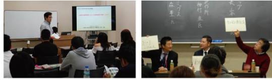
京都府山城広域振興局によるレクチャー