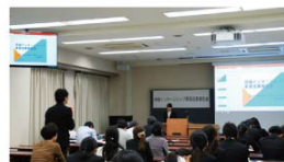
実習成果報告会の様子

今年度の地域インターンシップは受講生が42名ということで、昨年度の倍以上の規模での開講となりました。程度の差こそありますが、その多くが就職活動を意識し、就業体験や職場体験を求めて、約半年間のプログラムに臨んでいます。